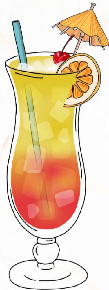
SEX ON THE BEACH

CONOCIDO POR SU NOMBRE PROVOCATIVO, PERO SU SABOR ES INOLVIDABLE. VODKA, LICOR DE MELOCOTÓN, ARANDANO, GRANADINA Y ZUMO DE NARANJA