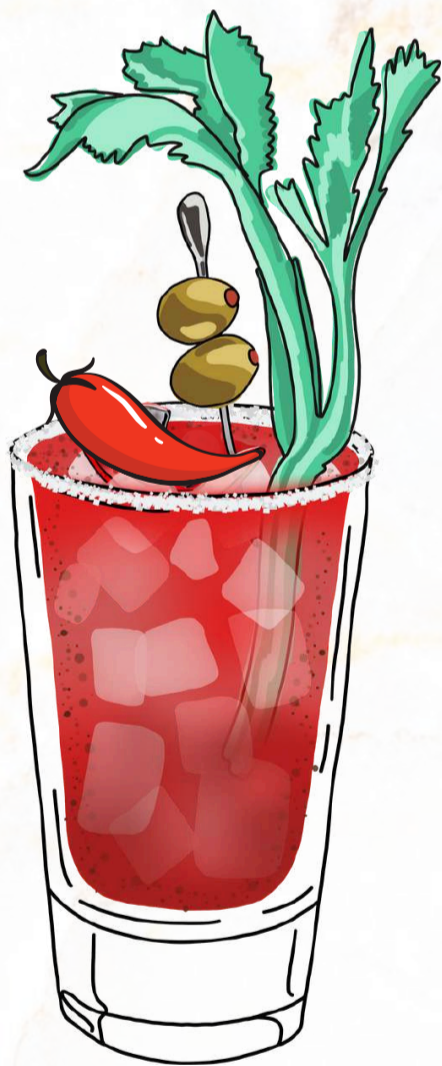
BLOODY MARY SPICY

EL DESPERTAR DEL ALMA. VODKA, ZUMO DE TOMATE, TABASCO, SAL SPICY, PIMIENTA NEGRA, SALSA INGLESA Y LIMA. DESPIERTA TUS SENTIDOS Y CURATE DE LA RESACA.